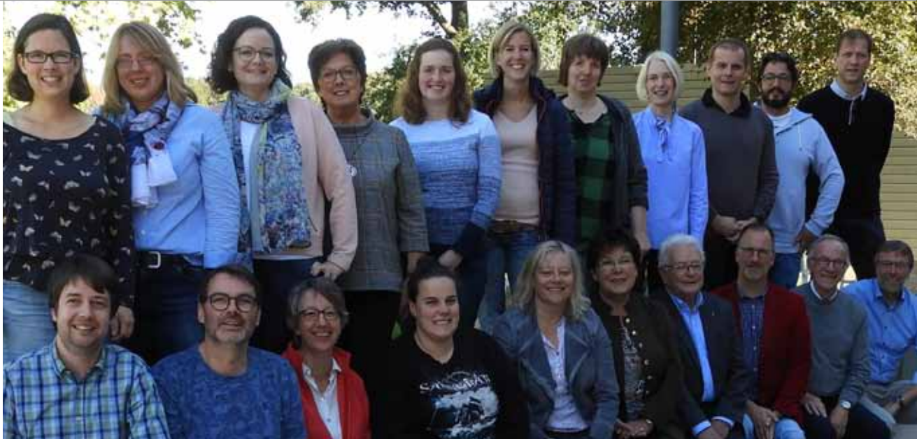
Pfarreirat Anna Katharina auf der Klausurtagung 2018

Kinder sind unser höchstes Gut und brauchen unsere Fürsorge und unseren Schutz. Wir haben uns als Kirchengemeinde auf den Weg gemacht, um alle haupt- und ehrenamtlichen Mitarbeiter*innen für den Schutz der Kinder vor sexualisierter Gewalt zu sensibilisieren, sie fortzubilden und sie auf einen entsprechenden Verhaltenskodex zu verpflichten. Die drei katholischen Coesfelder Gemeinden haben ein institutionelles Schutzkonzept entwickelt, das sie umsetzen und so ihren Beitrag zum Schutz der Kinder, Jugendlichen und anderer schutzbedürftiger Menschen leisten werden.